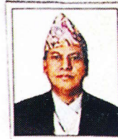
सिंहदरवार, काठमाडौं, नेपाल।