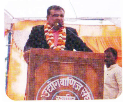
सुनसरीमा गरिएको सम्मान कार्यक्रमका केही भलकहरु