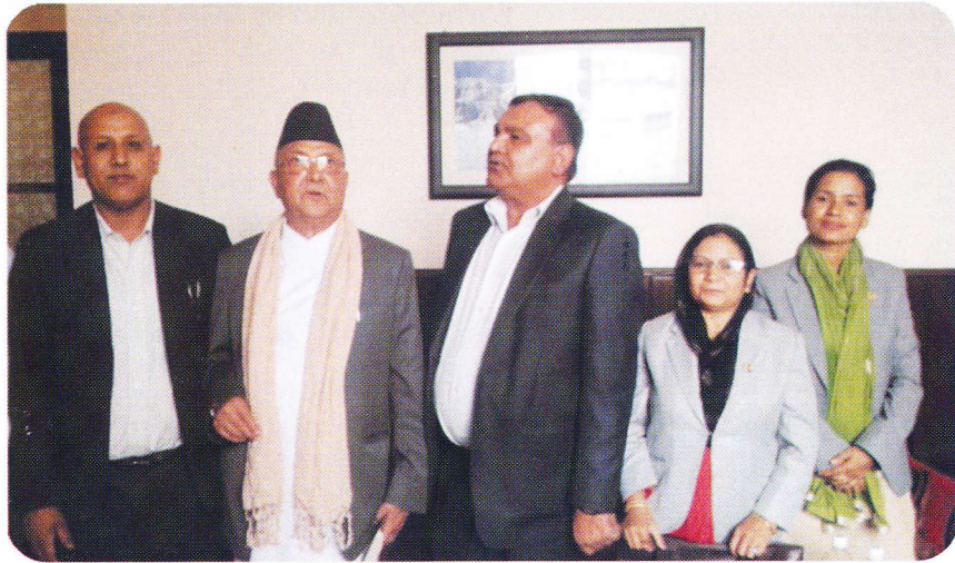
नेपाल हज समितिको सम्बन्धमा छलफल गर्दै स्वर्गिय पुर्व प्रधानमन्त्री शुशिल कोइरालाज्यूसंग