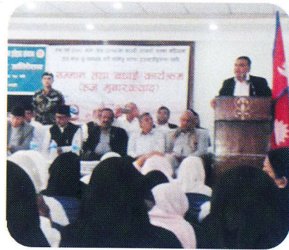
माननीय गृहमन्त्री शक्ति बहादुर बस्नेतज्यूबाट कास्की, स्याङ्जा, तनहु, गोर्खा, चितवन र पाल्पाका हाजी तथा हज्जीनहरुलाई पोखराको मिया पाटनमा सम्मान गरिदै ।