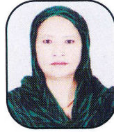
सदस्य, कलिला खाँ व्यास न.पा.२ तनहु