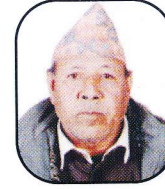
सदस्य, सहिदिन मियाँ पाली २, अर्घाखाची