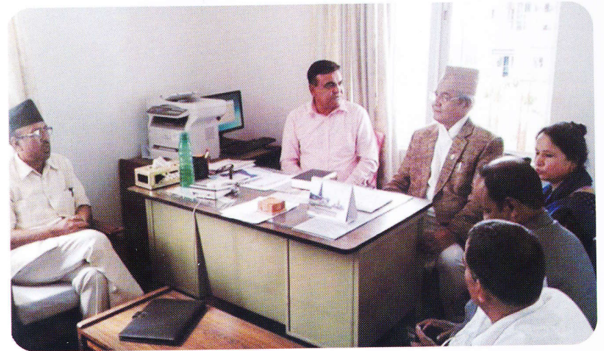
हाजीकोकोटा सम्बन्धमा साउदीका राजदुत तत्कालिन उपप्रधान तथा गृहमन्त्रीको रोहबरमा गृह मन्त्रालयमा छलफल पछिको क्षण