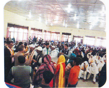
कपिलवस्तुमा गरिएको सम्मान कार्यक्रमका केही भलकहरु