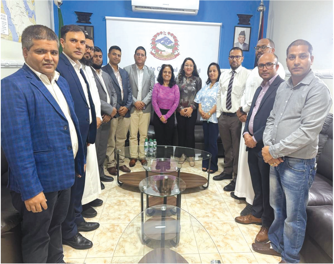
सन् २०२५ को हज व्यवस्थापनको अनुगमन टोलीका साथ नेपाली कन्सुलेट जनरल जेद्दा कर्मचारी परिवार ।