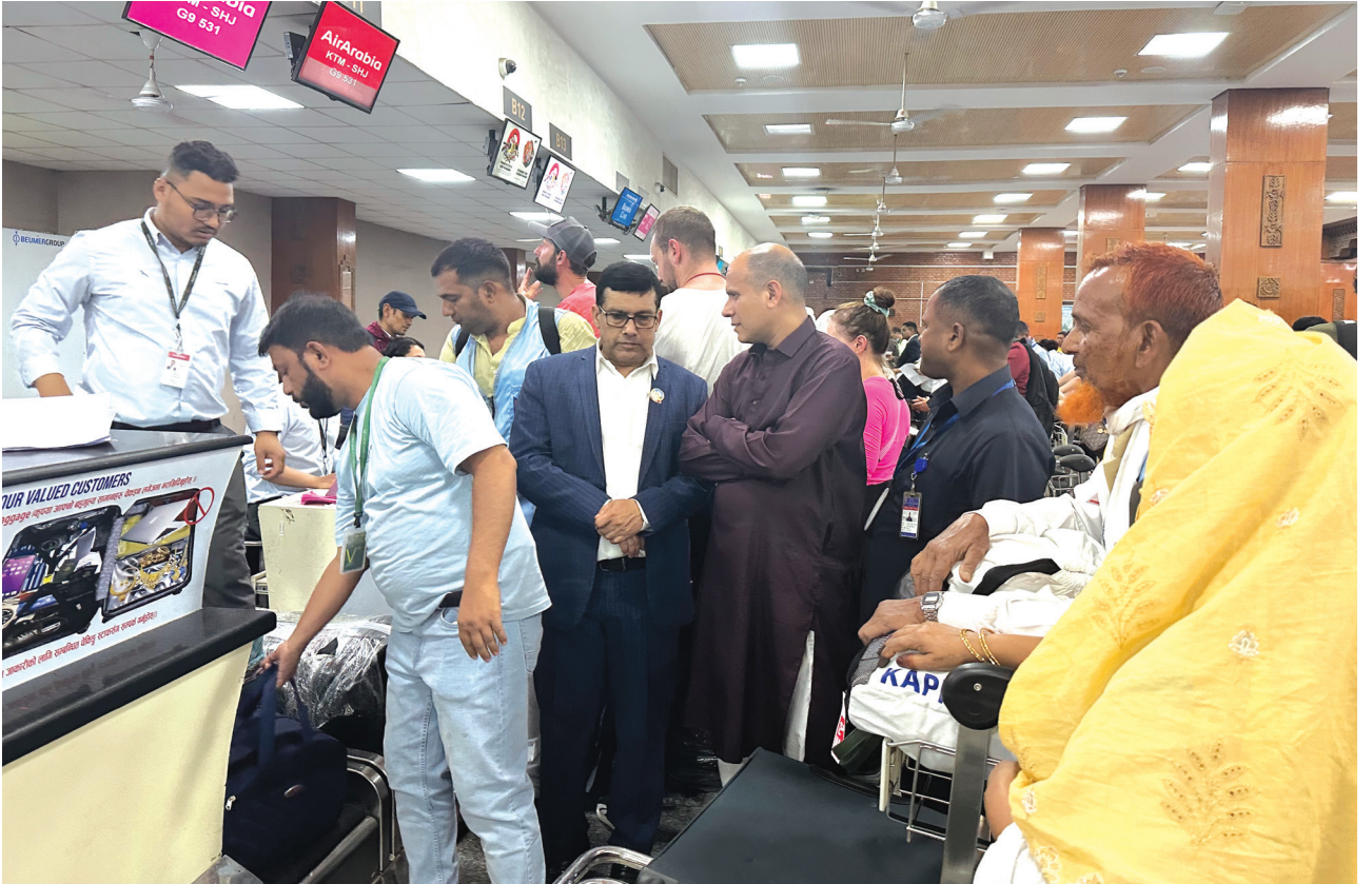
नेपाली हजयात्रीहरूलाई TIA मा Air Arabia ले छुट्टै Boarding Desk उपलब्ध गराई सेवा दिएको ।