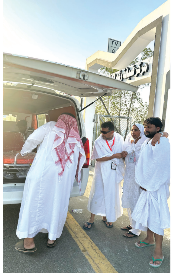
नेपाली हजयात्रीहरूलाई स्वास्थ्य सेवाको लागि गरिएको प्रबन्ध ।