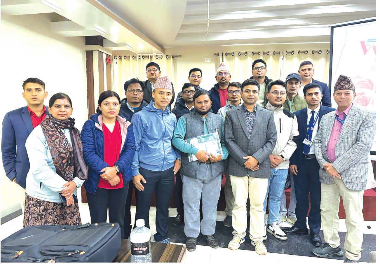
जिल्ला प्रशासन कार्यालयका कर्मचारीहरूका लागि हजसम्बन्धी सूचना व्यवस्थापन प्रणालीको अभिमुखिकरण कार्यक्रम, बुटवल, रुपन्देही ।