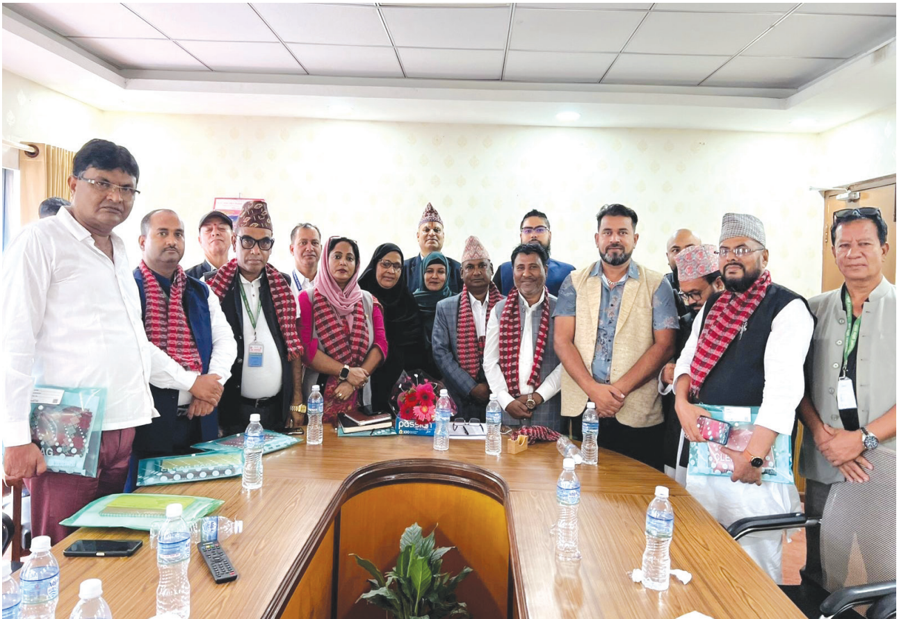
वर्तमान नेपाल हज समितिको पहिलो बैठक: सिंहदरवार