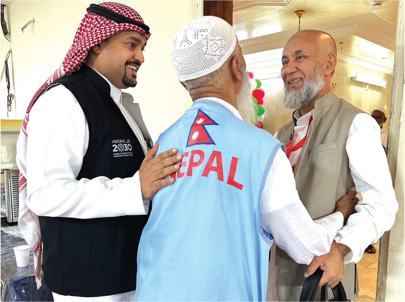
साउदी अरबको मक्कामा नेपाली हजयात्रीहरूलाई स्वागत गरिदै ।