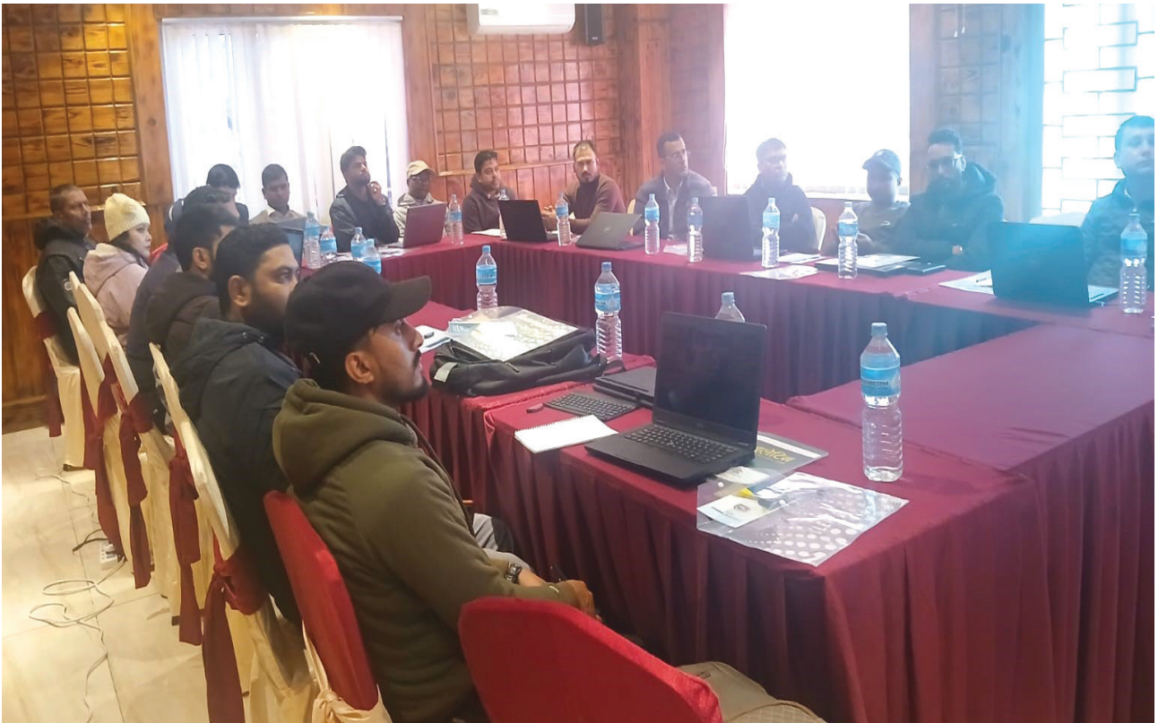
जिल्ला प्रशासन कार्यालयका कर्मचारीहरूका लागि हज सूचना व्यवस्थापन प्रणालीको अभिमुखिकरण कार्यक्रम, बर्दिबास, महोत्तरी