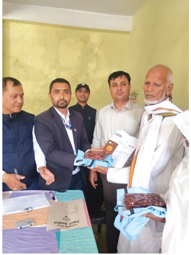
हजयात्रीहरूलाई नेपाल हज समिति एवम् अन्य निकायहरूबाट दिइएको सहयोग वितरण एवम् राहदानी, भिसा र टिकट वितरण गर्दै कर्मचारीहरू ।