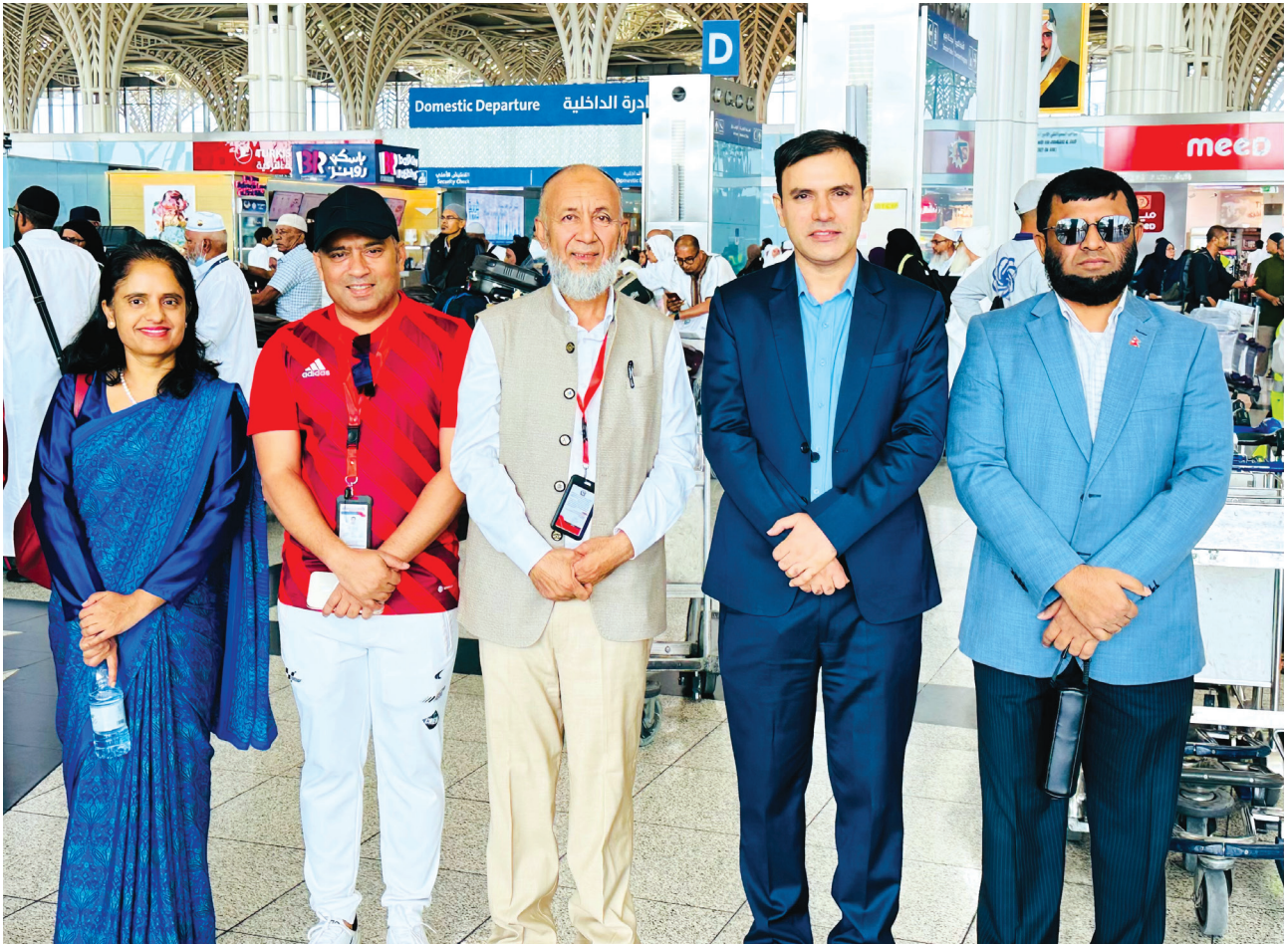
हजयात्रीहरूलाई साउदी अरबको मदिना स्थित एयरपोर्टमा विदाईको क्रममा नेपाली कन्सुलेट जनरलका कर्मचारीहरूका साथमा नेपाल हज समितिका पदाधिकारीहरू ।