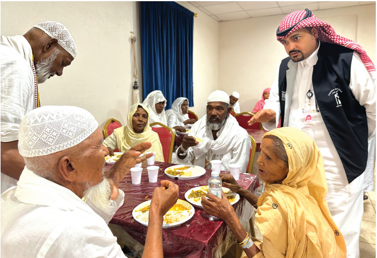
साउदी अरेबियाको मक्का स्थित आवासमा नेपाली हजयात्रीहरू खाना खाँदै ।