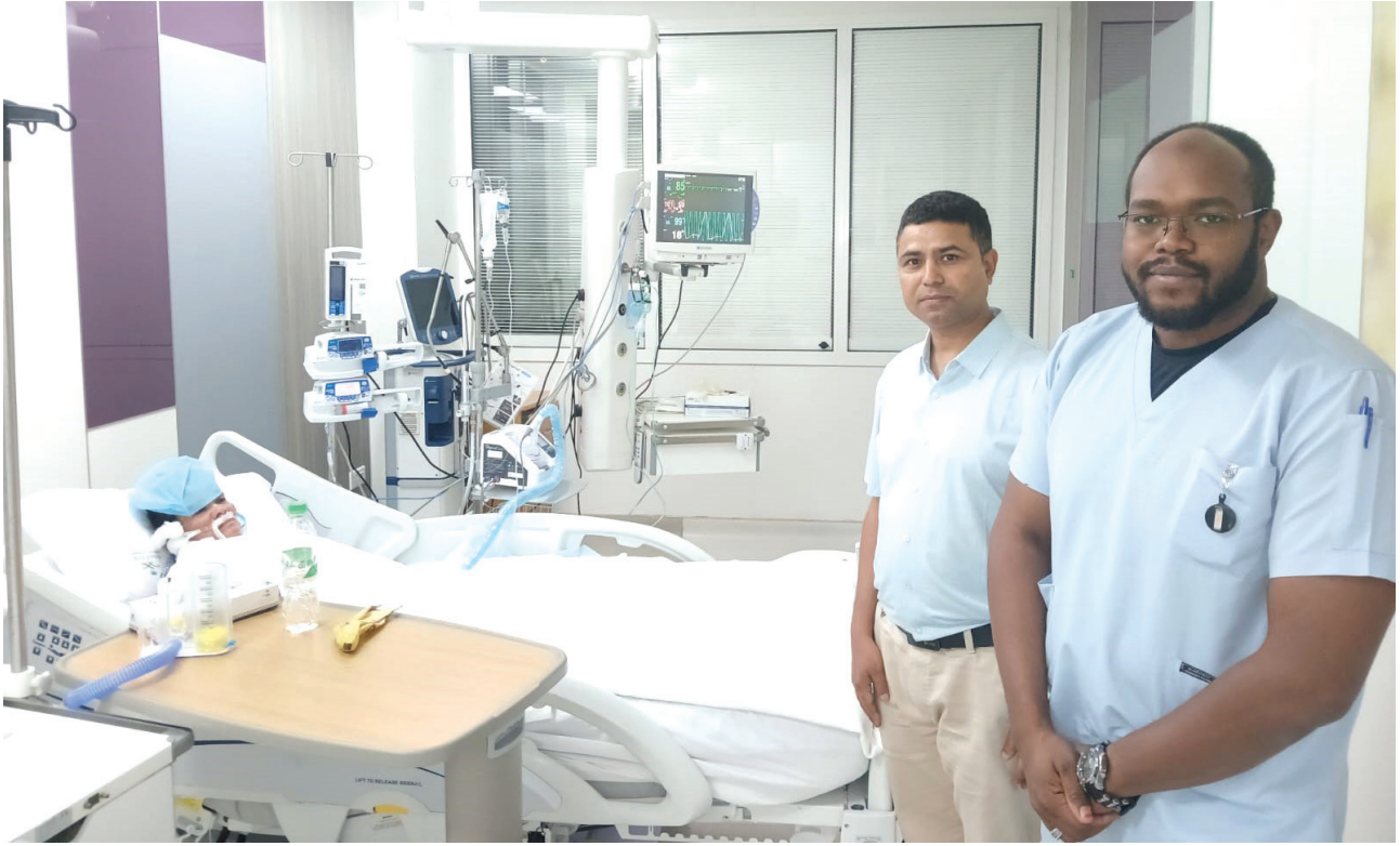
साउदी अरबको मदिना स्थित अस्पतालमा विरामी नेपाली हज्जीनको स्वास्थ्य अवस्थाका बारेमा जानकारी लिदै कर्मचारी ।