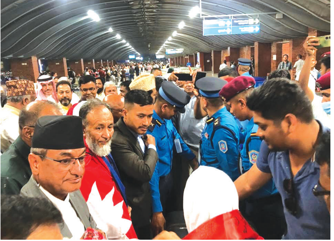
सन् २०२५ को हजमा सहभागी हुनजाने हजयात्रीहरूलाई TIA मा विदाई गर्दै गृह मन्त्री रमेश लेखक, हज समितिका अध्यक्ष एवम् अन्य विशिष्ट व्यक्तिहरू ।