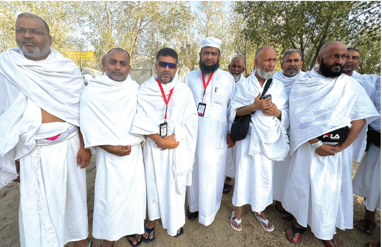
सन २०२५ को हजमा साउदी अरबको मक्कामा हजयात्रीहरूको साथमा हज प्रतिनिधिमण्डल ।